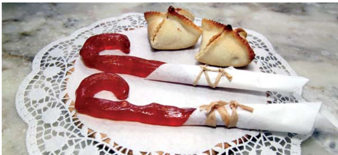
● Os bolos de que se fala