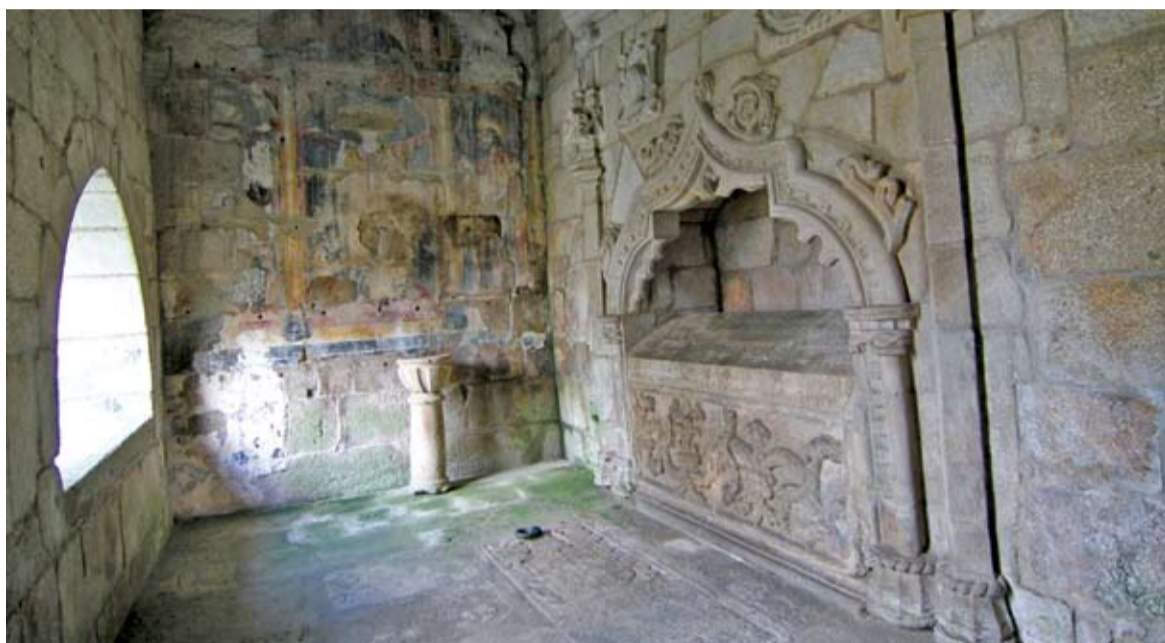
● Capela de S. Brás, em Vila Real