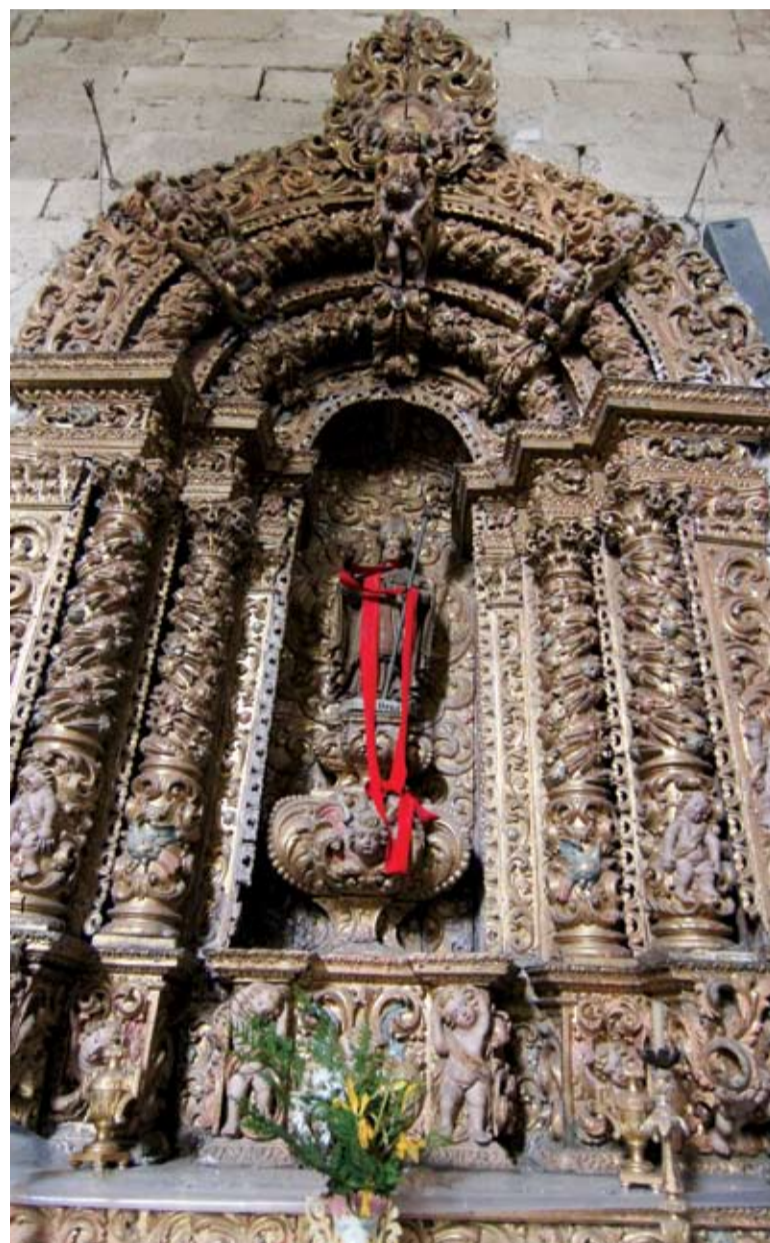
● Imagem de S. Brás, em Vila Real